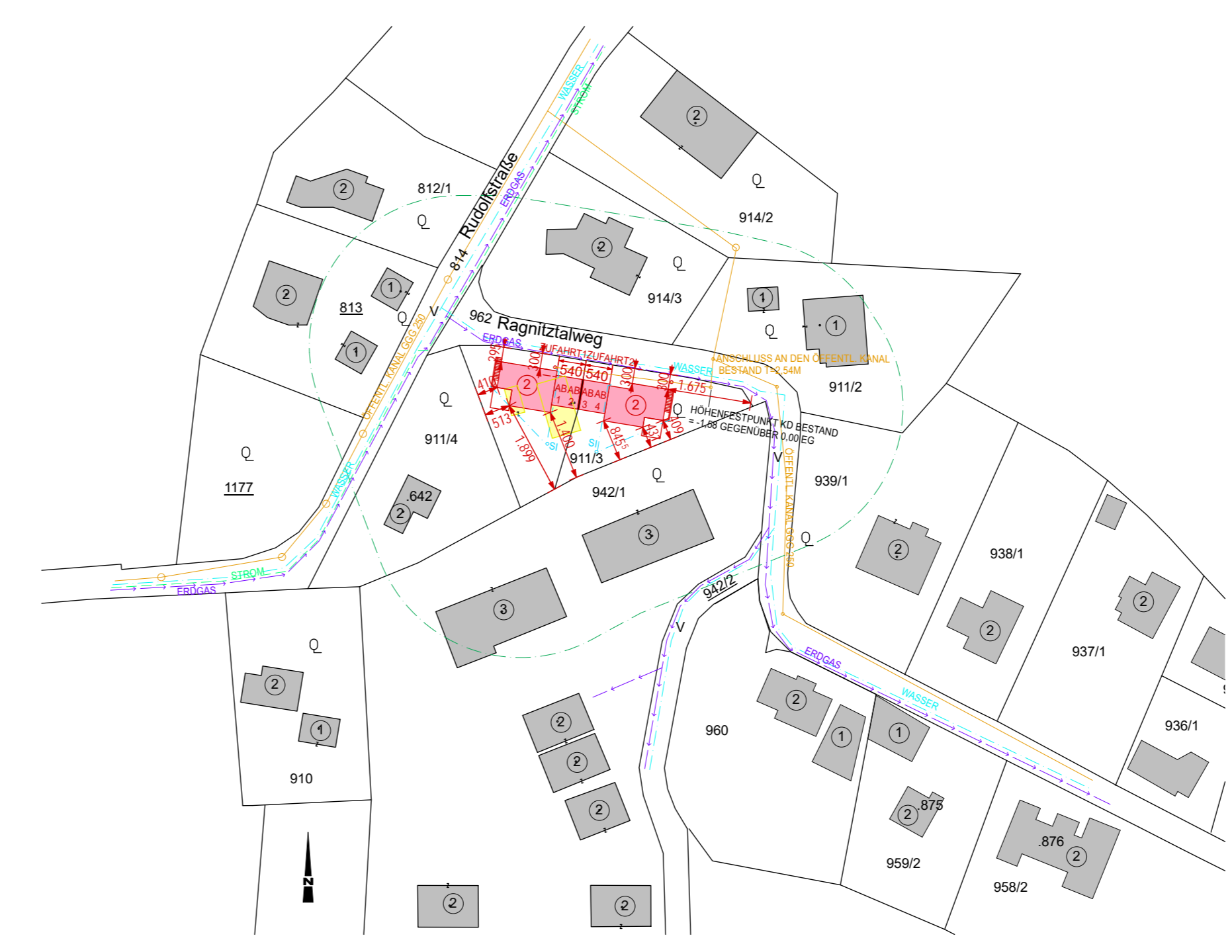
HÖHENFESTPUNKT: KANALDECKEL BESTAND= -1,58 GEGENÜBER 0,00 Lageplan M.:1:1000

DER AUSNAHME AUS DEM BAUVERBOTSBEREICH NACH §24 Stmk. LstVG 1964 WIRD SEITENS DES STRASSENAMTS ZUGESTIMMT